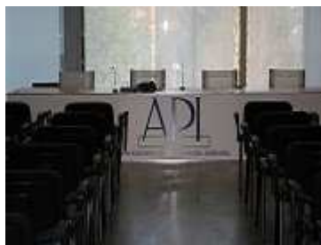
BAVENO - SS Sempione Km 87 vco@apimpresa.it

Associazione Piccole e Medie Industrie delle Province di Novara, V.C.O. e Vercelli