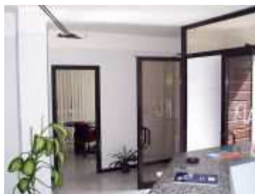
BORGOMANERO - Viale Marconi 115 borgomanero.info@apimpresa.it